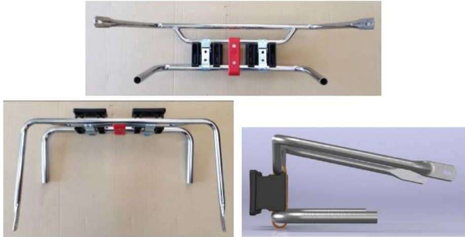
PHOTOS VUE DE DEVANT, DE DESSUS ET DE COTÉ, DU KIT DE MONTAGE CARENAGE AVANT AVEC SUPPORTS

This Homologation Form reproduces descriptions, illustrations and dimensions at the moment of the CIK-FIA homologation.